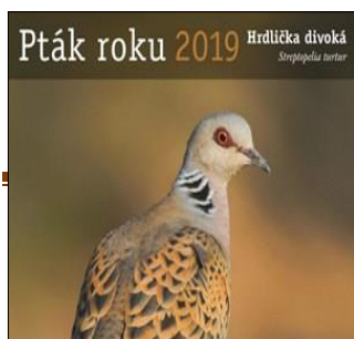
Pták roku 2019 – Hrdlička divoká

Třetím rokem se škola pod názvem „ SPOLEČNĚ A ZODPOVĚDNĚ “ zapojuje do mezinárodního projektu Evropský týden udržitelného rozvoje . V týdnu od 30. 5. do 5. 6. se výuka zaměřuje na cíle udržitelného rozvoje a to jak v běžných hodinách, tak v rámci projektových dnů. Cílem všech aktivit v rámci ETUR bylo vybavit žáky takovými kompetencemi, které jim umožní realizovat zásady udržitelného rozvoje v praktickém životě. Proto se stále častěji principy UR stávají i součástí běžných hodin. Všechny aktivity byly i s krátkou anotací a odkazem na web školy zaregistrovány na webových stránkách organizátora: www.tydenudrzitelnosti.cz . Tím došlo k významné propagaci základní školy. Tabulka akcí jednotlivých tříd je vložena na konci zprávy EVVO, školní družina se hlouběji zaměřila na celosvětový problém - plýtvání. Děti si uvědomily plýtvání vodou, potravinami a energiemi.